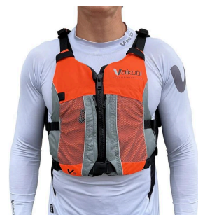
V3 Ocean Racing PDF