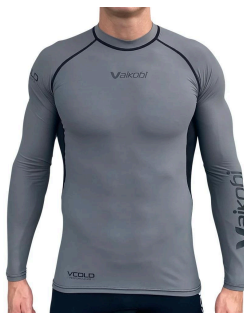
VCold L/S Base Layer